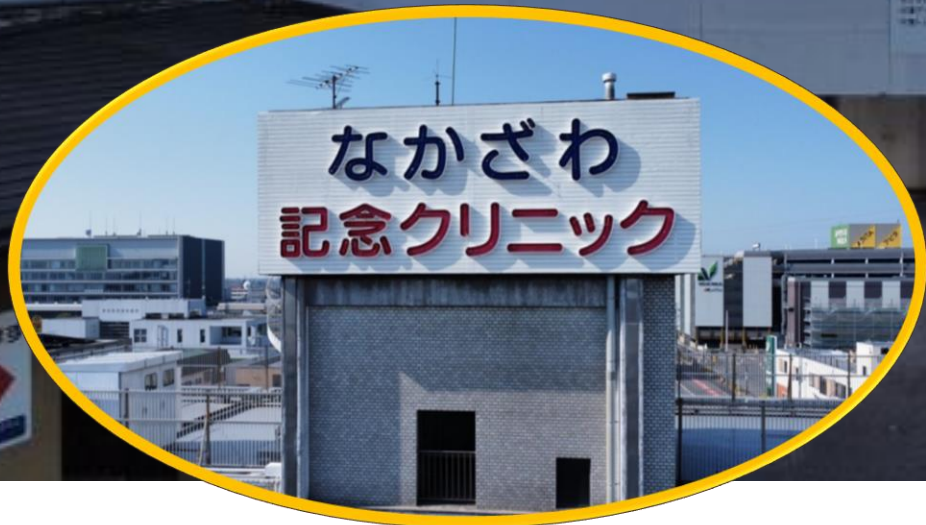
なかざわ記念クリニック