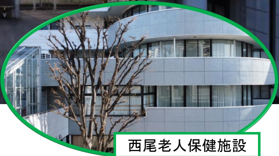
西尾老人保健施設