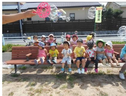
しゃぼんだま とんだ～