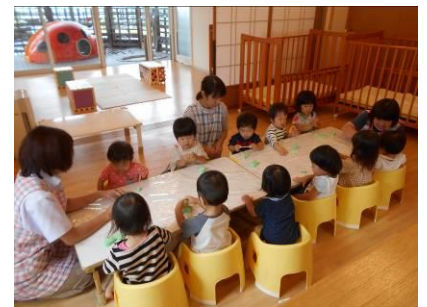
小麦粉粘土 こねこね・・・