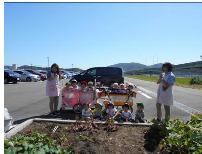
さつまいも ほったよ！