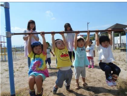
上手にぶらさがれるようになったよ！