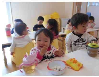
みんな大好きもぐもぐタイム