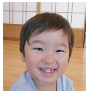
可愛い兄妹の仲間入りです。仲良くしてね♪