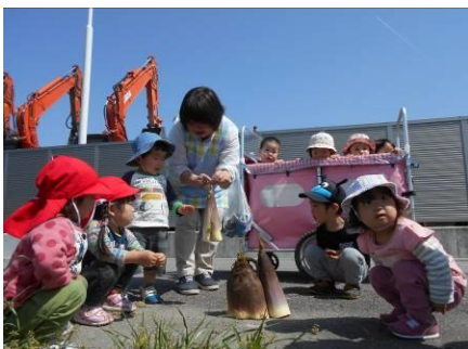
たけのこのお洋服 発見！