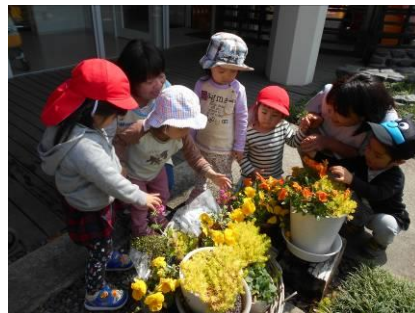
何色のお花が好き？