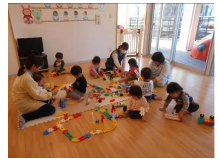
ブロックあそびに夢中ですよ♡