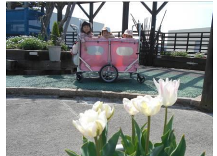
チューリップがさいたね