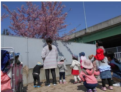
みんなでお花見！きれいだね