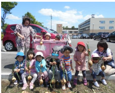
大きな玉ねぎとったよ