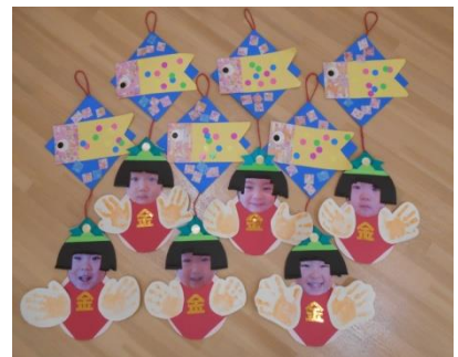
金太郎さんに変身☆