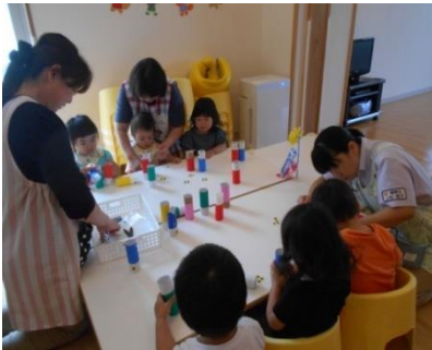
こいのぼり制作中