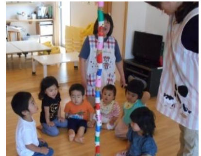
こいのぼりがつながった!