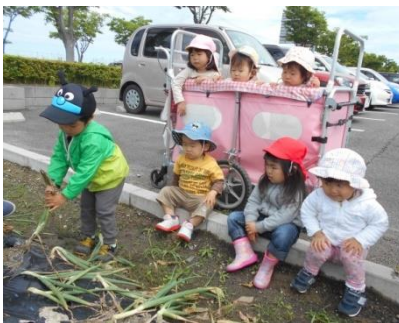
うんとこしょ! どっこいしょ!