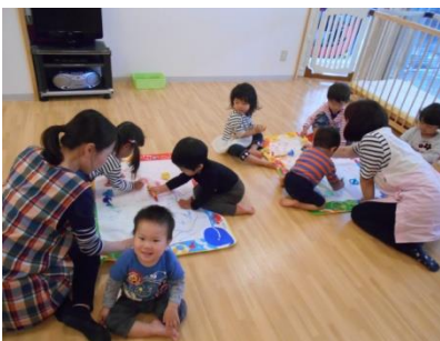
水ペンでお絵かき楽しいね