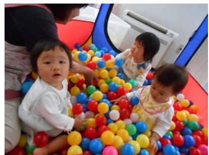
カラフルなボールに夢中です