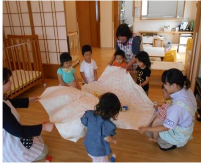
おもしろそうに泳いでる～♪