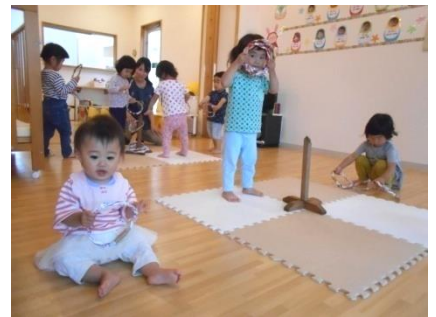
輪投げあそび楽しいな♡