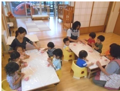
小麦粉粘土こねこねこね…