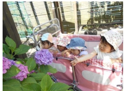
紫陽花が咲いたね