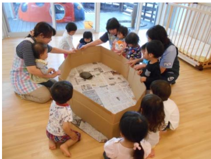
かめさん、顔見せて