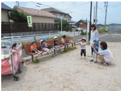
しゃぼんだま、とんでけ〜♪