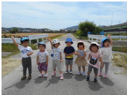
かけっこ頑張るぞ!おお〜!!