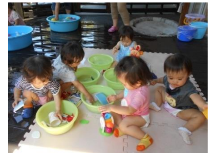
託児での水遊びデビュー