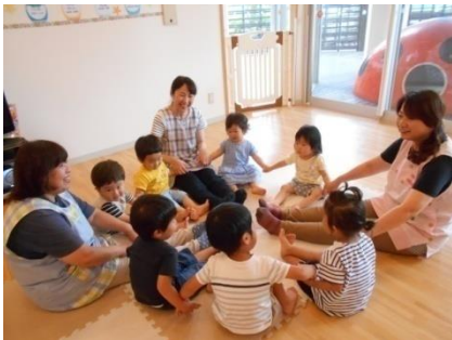
皆で集まって、輪になぁ～れ！