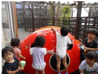
ピカピカに磨き上げます