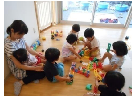
ディズニーランド建設中！