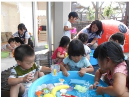
水遊びは気持ちがいいね