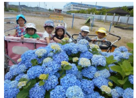
公園の紫陽花きれいだね