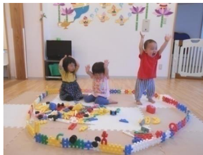
お風呂の完成！やった〜