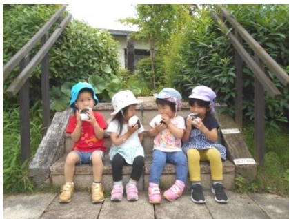
おにぎり、本物みたいでしょ！