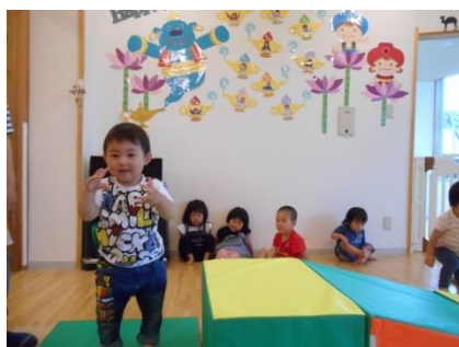
上手にマット渡れるかな？