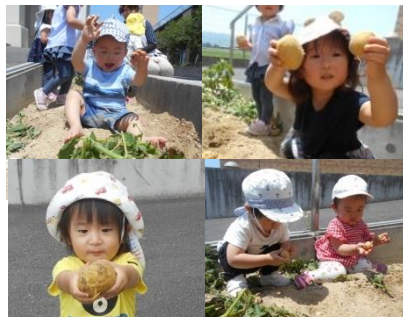
じゃがいも掘りしたよ