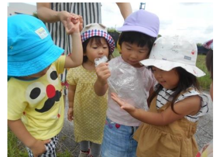
アマガエル、み〜つけた♪