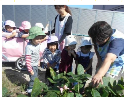
枝豆が大きく育っているね