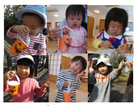
ハッピーハロウィン♪