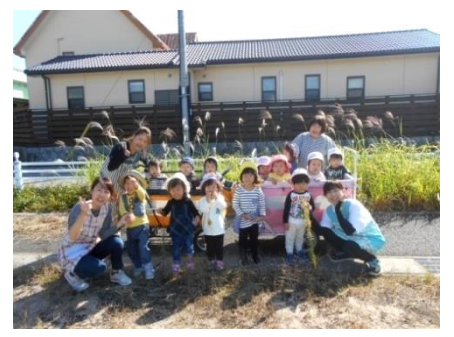
すすきがいっぱいだね！