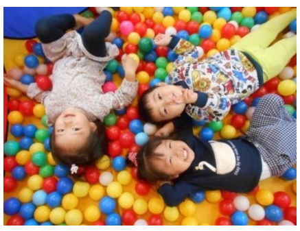
ボールに囲まれて幸せ～