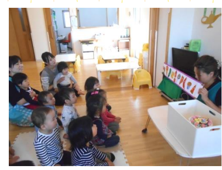
はらぺこシアター鑑賞中

砂遊びでは遊びに夢中で服に砂がかかってもへっちゃら。順番にすべり台を滑ったり、かけっこや電車ごっこをしたり。いつもあっという間に時間が過ぎていきます。子ども達の中には、初めての体験でとまどう子もいましたが、2回・3回と繰り返すとその遊具や遊び方が次第に分かり、楽しむ姿もみられました。子どもの順応性は素晴らしいです。これからも、友達と一緒に色々な経験を楽しみながら成長を見守っていきたいと思います。