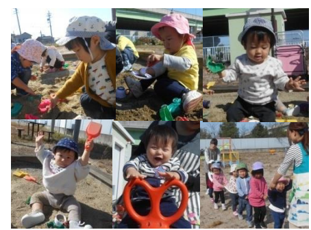
天気のいい日は公園へ…