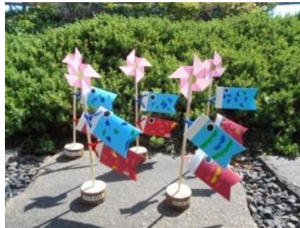
オリジナルいのぼり