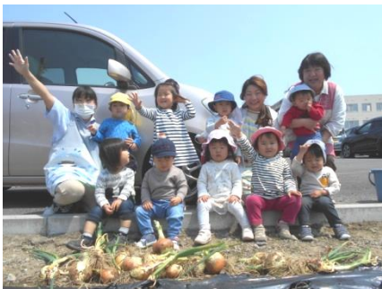
玉ねぎいっぱい収穫したよ♪