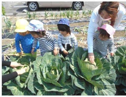
大きなキャベツにびっくり！