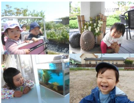
今日はどんな1日になるかな？

さわやかな風にあたたかい日差し。お散歩が気持ちいい季節です。散歩では、畑の横を通る度に成長している玉ねぎを見て収穫するのを楽しみにしていた子ども達。いざ玉ねぎ掘りを行なうと、ねぎの部分があたり、根っこがお髭みたいに伸びていたり、また新鮮だからこその匂いがあったり…スーパーで売っている玉ねぎと異なる姿に子ども達の中には複雑な表情をする子もいました。それでも力いっぱい玉ねぎを引っ張り、視覚・触覚・嗅覚などの五感を存分に活用した収穫となりました。持ち帰った玉ねぎは、夕飯でカレーライスやハヤシライスに変身！自分で収穫した満足感とお家の人から「すごいね！」と褒めてくれた喜びがスパイスになって、格別美味しい夕飯になったようですね。ひとつの行事を乗り越え、またひとつ逞しくなった子ども達でした。