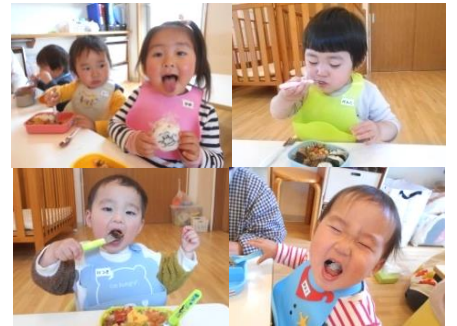
待ってましたお弁当タイム！