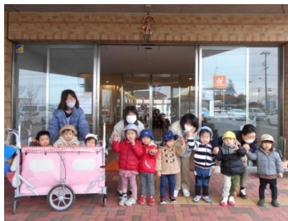
2021年のスタートです