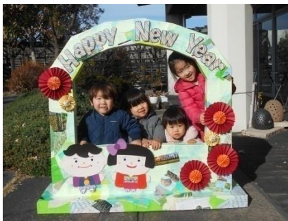
Happy New Year !