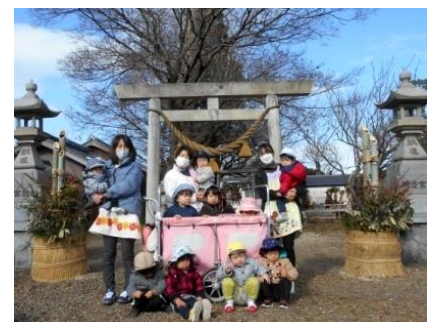
神社へ初詣にいきました