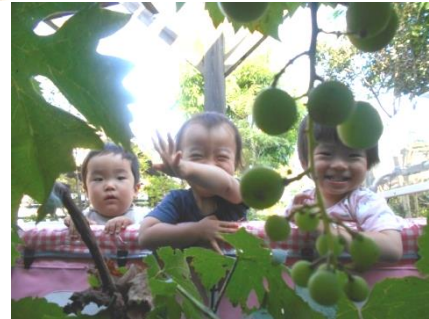
ぶどうが大きくなってきたね！