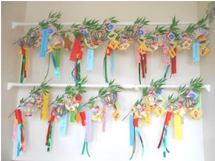
みんなの願い、天までとどけ～