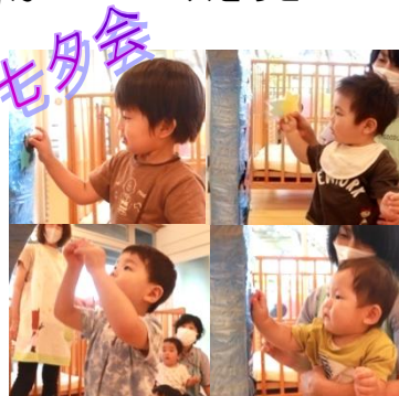
七夕会では、みんなで星をさがして天の川をつくったね☆