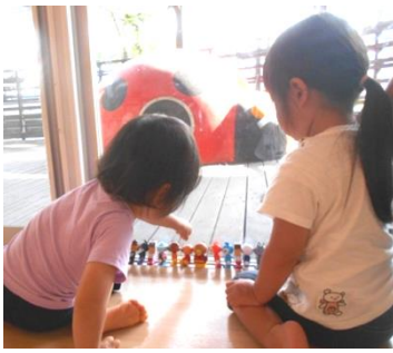
アンパンマンの仲間達！整列