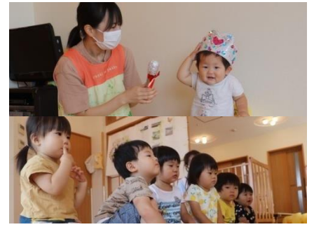
8月生まれのお誕生日会♪