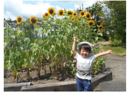
向日葵のようにおおきくなるぞ～