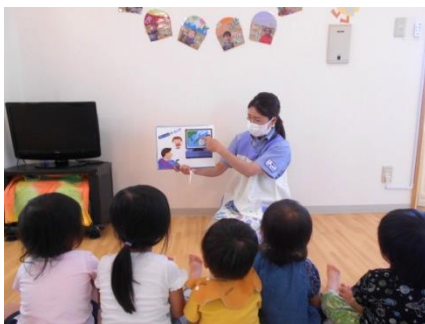
8月の防災訓練（台風のお話）

令和3年夏。いよいよ子ども達が待ち望んでいた水遊びが始まりました！！シャワーから出る水に自ら手を伸ばし、飛び散る水しぶきに大興奮。笑い声と歓喜の声で託児室のウッドデッキはとてにぎやかです。水遊びは不思議がいっぱいです。バシャバシャと水面をたたくと水がはねる。プカプカと玩具が水面に浮かぶ。洗面器をひっくり返すと水が流れる。コップで水がすくえる。 どうして？なんで？初めて水遊びをする子ども達の表情からはそんな思いがうかがえます。ひとつひとつの現象が子ども達にとっては新たな発見であり、全てが経験です。この季節ならではの遊びを多いに楽しみ、体験を通して子ども達が豊かな感性や探究心が育まれる環境を作っていきたいと思います。