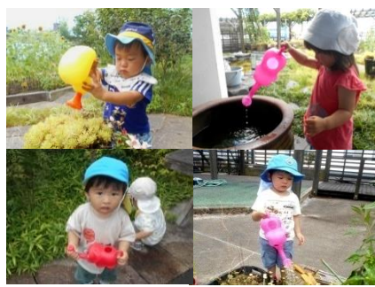
お花に水をあげましょう