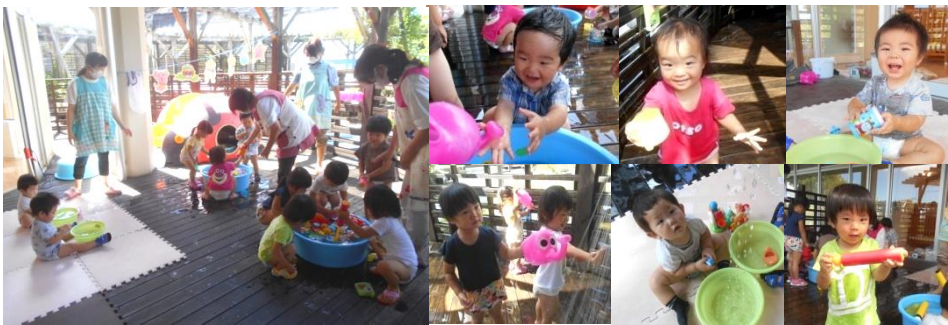
水あそびは不思議がいっぱい！ワクワク・ドキドキが止まらないね！！