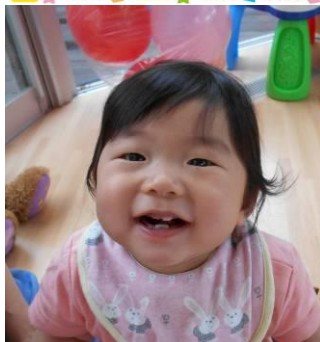
6 月から仲間入りの C ちゃん。 一緒に遊ぼうね♪