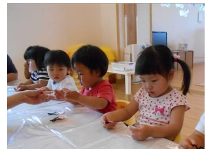
織姫と彦星 制作中