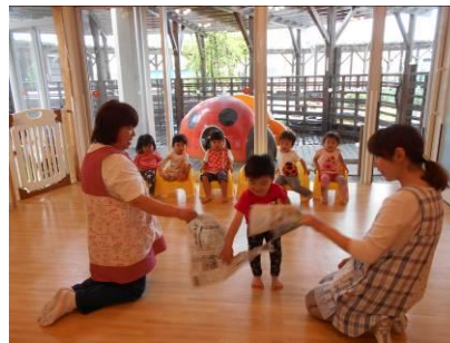
しんぶんやぶり「アチョ～！」