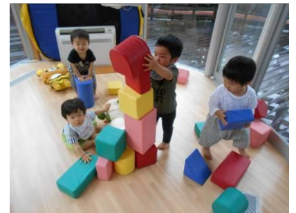
ソフレーブロック たかいたかい！