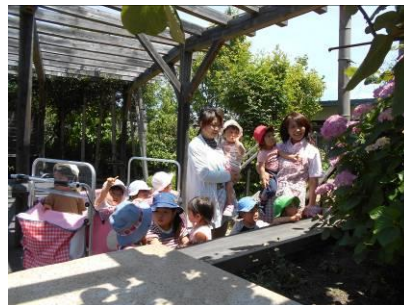
あじさいがきれいにさきました