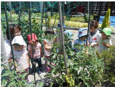
トマトがいっぱい実ってるね♪