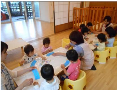
クレヨンで模様を描いています