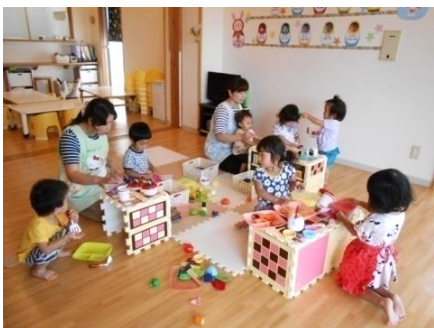
ちいさなコックさんは大忙し