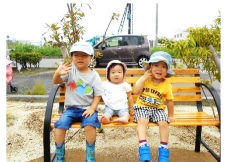
ベンチでちょっと休憩♪