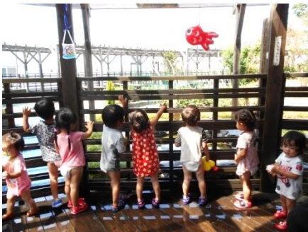
あっ！飛行機み～つけた!!