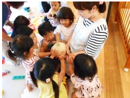
メロンのあみあみに触ったよ