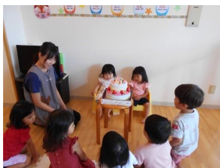
みんなでお祝い♡おめでとう