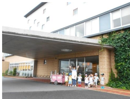
正面玄関からバイバ～イ