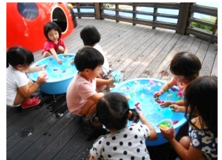
上手に金魚すくえるかな？