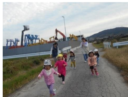
ゴールに向かってGO！