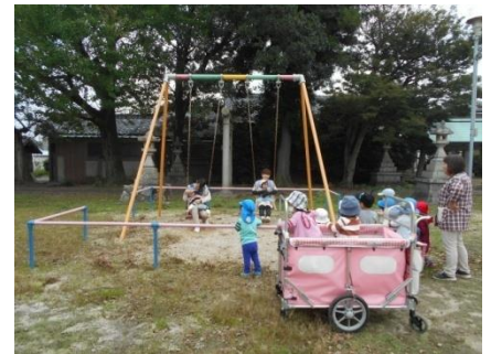
順番でブランコに乗ったよ