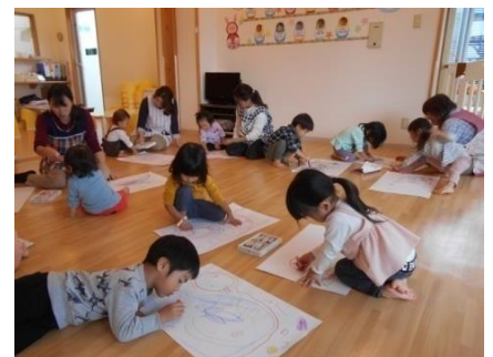
お絵描きに夢中です♡