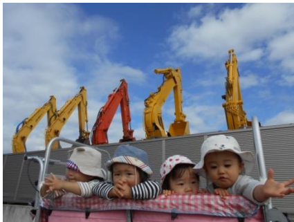
ショベルカーが並んでいるね！