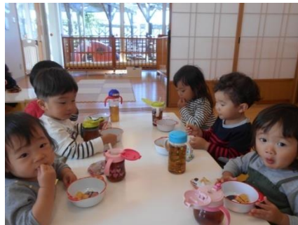
今日のおやつは何かな？