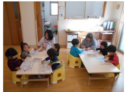
上手に色塗りできるよ！