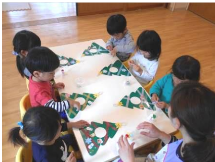
クリスマス飾り制作☆