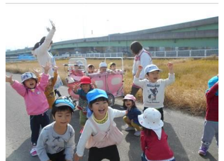
かけっこの後はバンザ～イ