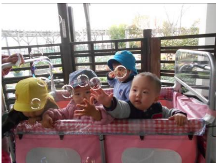
もう少しで触れそう…