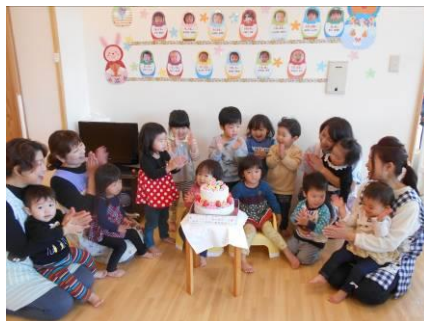
12月生まれの誕生会♪