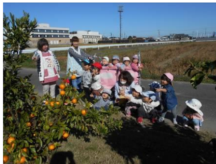
おいしそうな蜜柑み～つけた