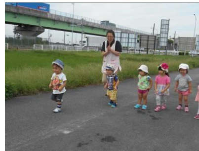
みんなでヨーイドン！