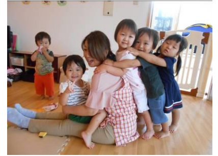
先生と電車ごっこ