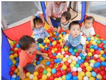
ボールプール楽しいね