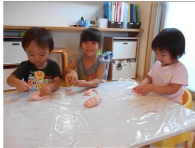
粘土で何作ろうか？