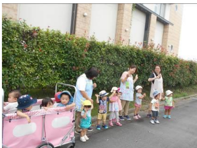
走るトラックにバイバイ