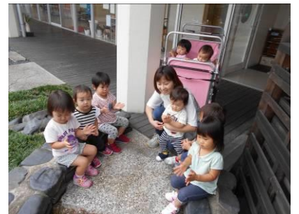
金魚さんこんにちは