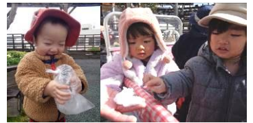
雪をギュッとしたら氷みだいなったよ