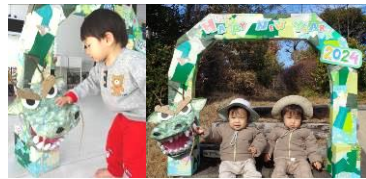
2024年、辰のように力強いこころ