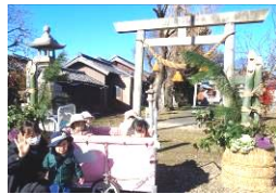
神社にお参りに行ったよ