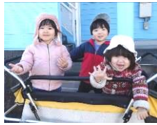
お散歩いってきます