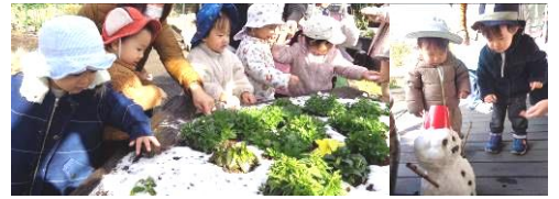
「雪やこんこ〜あられやこんこ〜」みんなテンションMAX