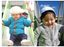
みんな大好きすべり台