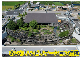
あいちリハビリテーション病院