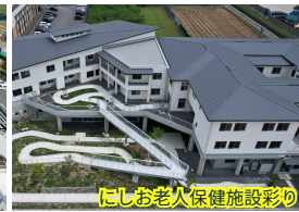
にしお老人保健施設彩り