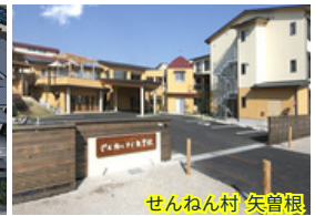
せんねん村 矢曾根