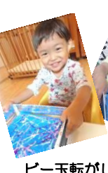
ビー玉転がしアート